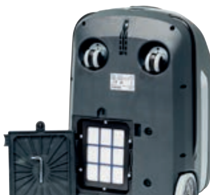
HEPA H13-filteret er standard på alle VP600 modeller