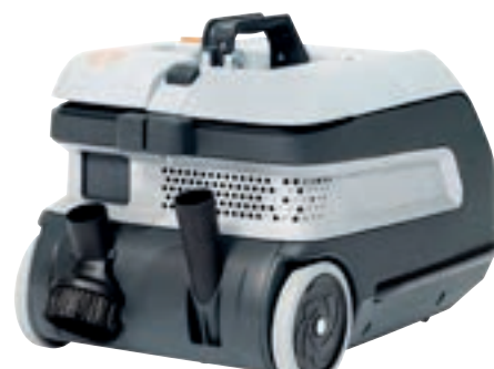
Brugervenligt tilbehør, der er nemt at komme til