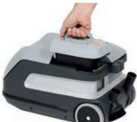
Nem adgang til batteriet gør det let og ligetil at oplade og udskifte det