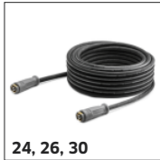
24, 26, 30