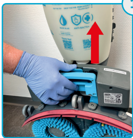
Tag batterierne af Remove the batteries