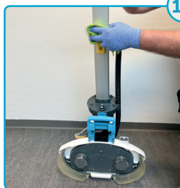
Tør hele maskinen af, når alt er afmonteret Wipe the entire machine down