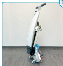
Saml imop igen og parkér oprejst Reassemble the i-mop and park it upright