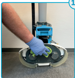
Tør af bag børsterne Wipe behind the