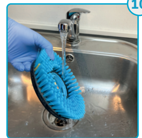
Skyl børsterne Rinse the brushes