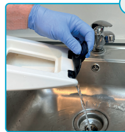
Tøm snavsevands-tanken Empty the dirt tank