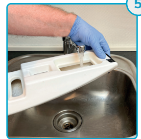
Skyl og ryst snavse-vandstanken 3 gange Rinse and shake the dirt tank three times