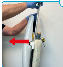
Tag snavsevands-tanken af Remove the dirt tank