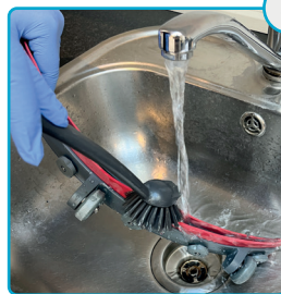
Børst ren og skyl Use brush to clean