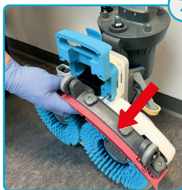
Tag sugefoden af Remove the squeegee