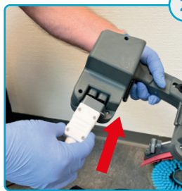
Sæt batterier i oplader Place the batteries into the charger