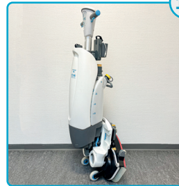
Saml i-mop igen og parkér oprejst Reassemble the i-mop and park it upright