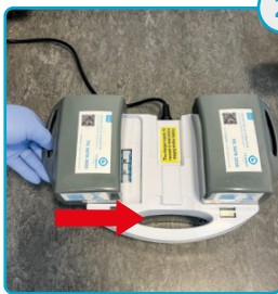
Sæt batterier i oplader Place the batteries into the charger