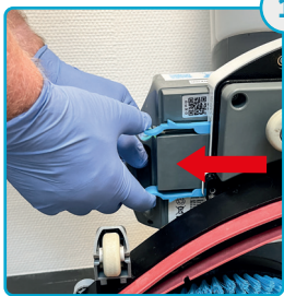
Tag batterierne af Remove the batteries