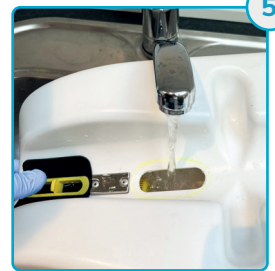
Skyl og ryst snavse-vandstanken 3 gange Rinse and shake the dirt tank three times