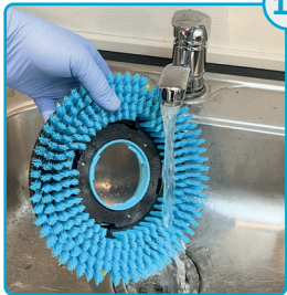
Skyl børsterne Rinse the brushes