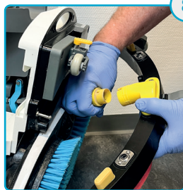
Tag slangen af Remove the hose