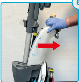
Tag rentvandstanken af og tøm den Remove the clean tank and empty it