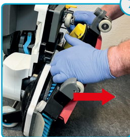
Tag sugefoden af Remove the squeegee