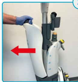
Tag snavsevands-tanken af Remove the dirt tank