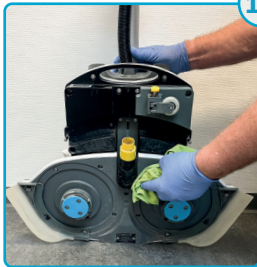
Tør af bag børsterne Wipe behind the brushes