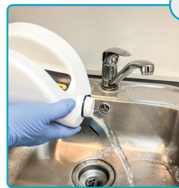
Tøm snavsevands-tanken Empty the dirt tank