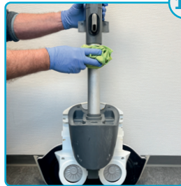
Tør hele maskinen af, når alt er afmonteret Wipe the entire machine down