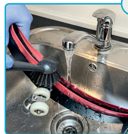
Børst ren og skyl Use brush to clean and rinse